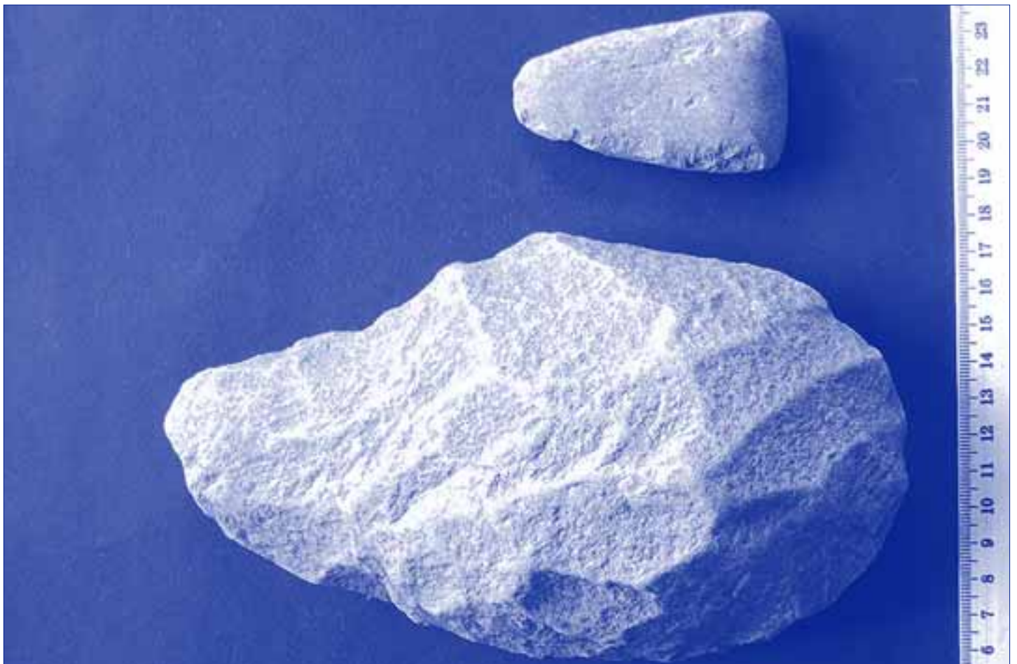
Bifaz de Lamata (abajo) y hacha de piedra pulimentada de Mondot (arriba)

En el Neolítico, de 6000 a 2500 años antes de Cristo (a.C.), las poblaciones optaron por una economía basada en la agricultura y la ganadería, quedando relegados a un segundo plano la caza y la pesca. Se siguió tallando el sílex e hizo su aparición el pulimento de las piedras, obteniéndose las hachas de piedra pulimentada. En la cuenca del Susía son abundantes estas hachas, de dimensiones variables. Fueron realizadas principalmente a partir de basalto, roca que se